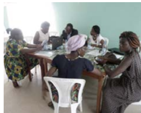
*OSC Taller de Validación (Monitoreo AGCED)

En cuanto al proceso de supervisión de la AGCED en sí, el reto sigue siendo proporcionar suficientes recursos a los puntos focales nacionales para ser más eficaces. La limitación de recursos también limita a su vez la relevancia y la fidelidad de los informes. El proceso de seguimiento también ganaría mucho en tener mecanismos permanentes, con clara conexión con la ejecución del programa de los ODS, antes del período de consolidación. Esto ilustra la necesidad de establecer un sistema efectivo y sostenible de monitoreo, evaluación y rendición de cuentas en el país.